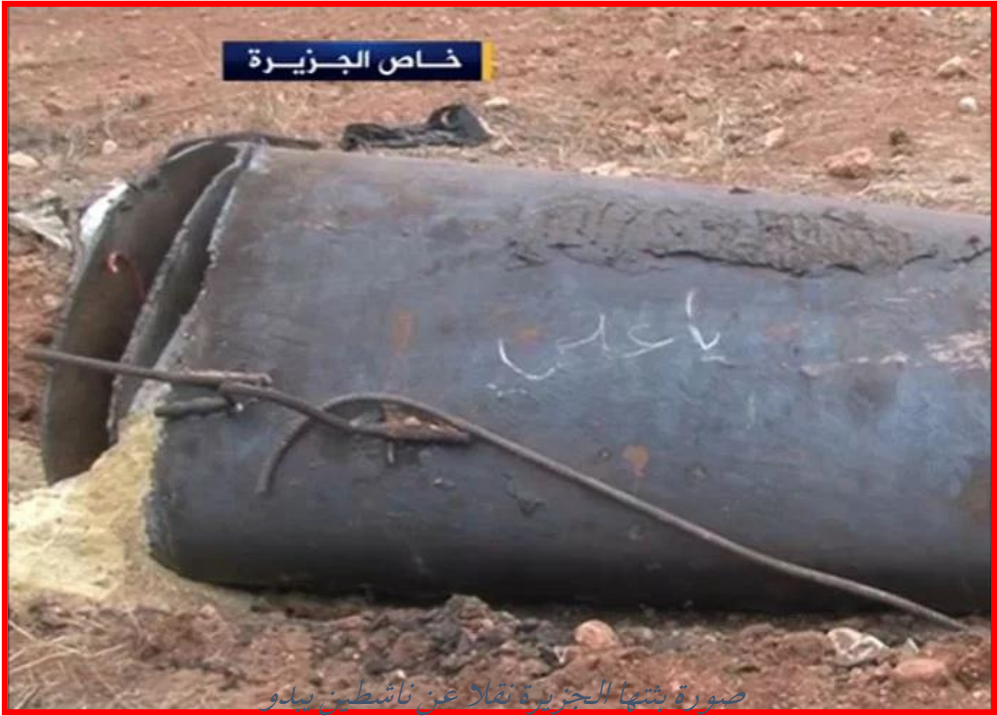
صورة التقطتها الجزيرة نقلاً عن ناشطين يبدو

فيها برميل لم ينفجر وهو يحمل شعاراً طائفياً